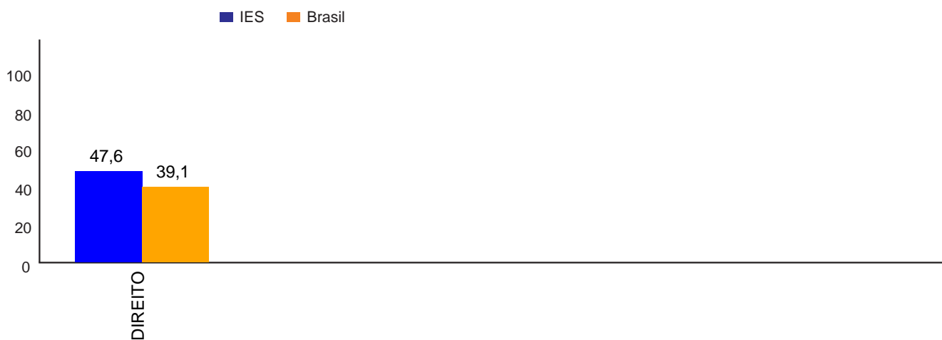
Gráfico 3 – Comparação entre as médias dos cursos da IES no Município e a média do Brasil, no Componente de Conhecimento Específico – estudantes concluintes – ENADE/2012

O mesmo foi feito com respeito às notas do Componente de Conhecimento Específico: apresentam-se também duas colunas com o total de estudantes da Instituição e o total de estudantes do Brasil na Área.